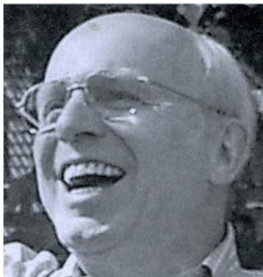
"Es lachen nicht alle, die das Maul breit machen" Demokrit