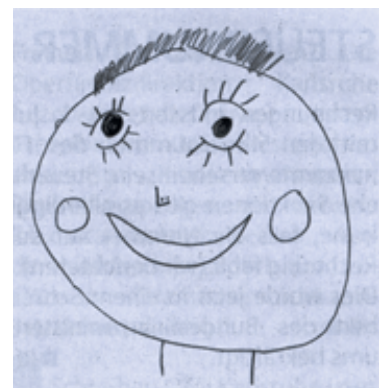
„In seinem Lachen liegt der Schlüssel, mit dem wir den ganzen Mengen entziffern“ Thomas Carlyle