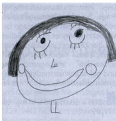
„Humor ist der Knopf, der verhindert, dass uns der Kragen platzt“ Joachim Ringelnatz